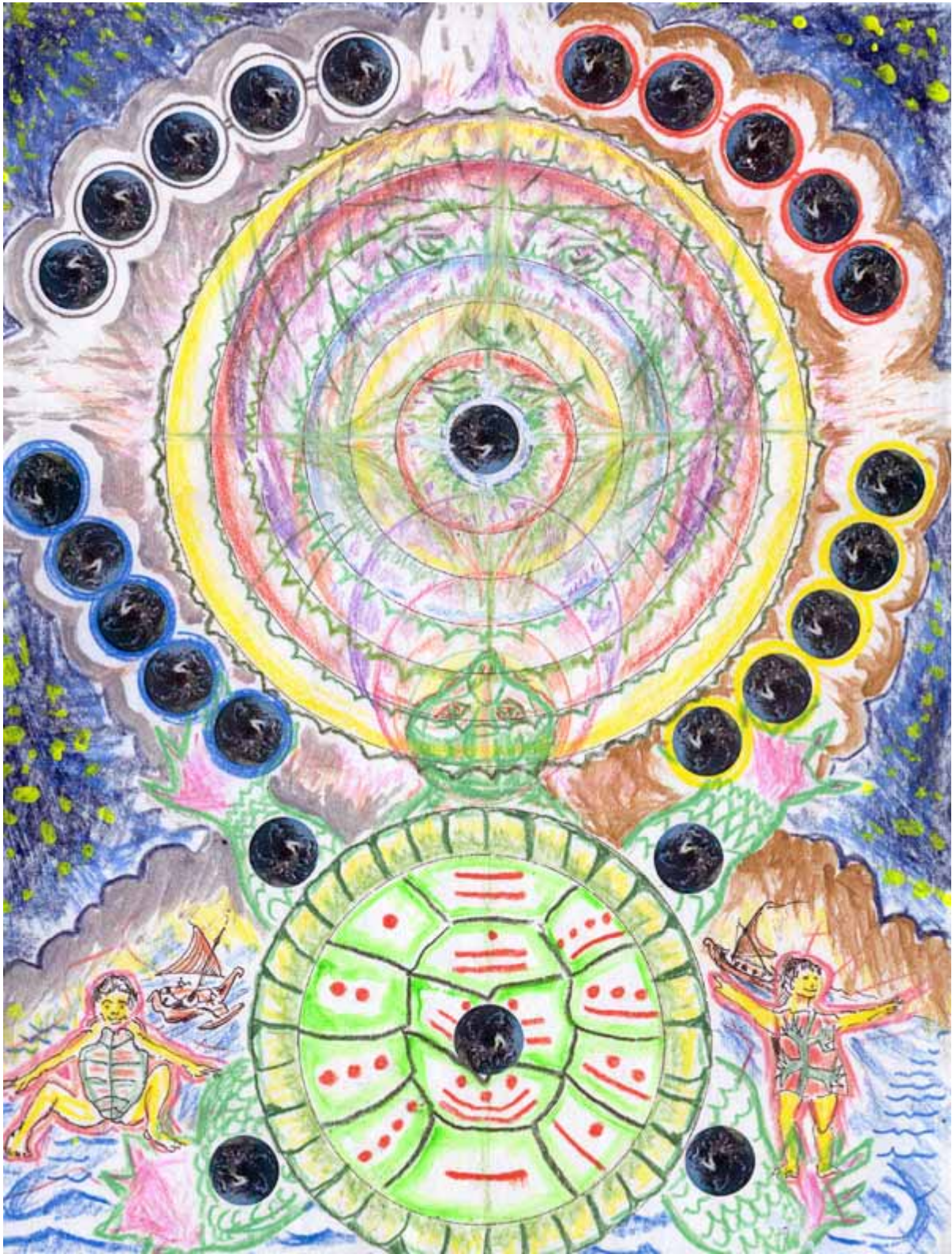
(25) MAGIC TURTLE, MAGIC TREE A GENERATION OF THE EARTH