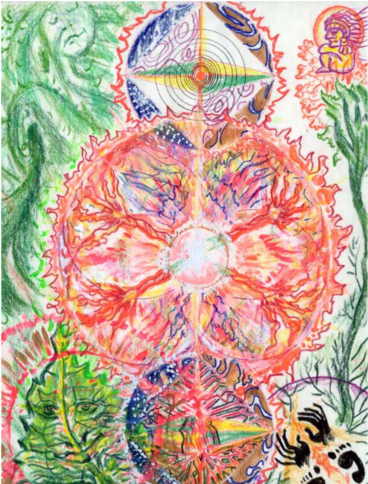
(14) TURTLE GOES TO THE MOON