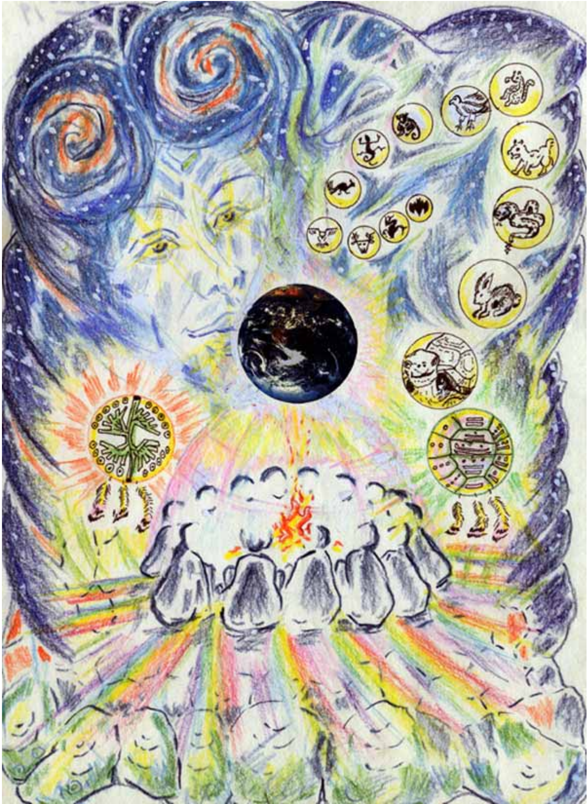
(19) COUNCIL OF THE PEOPLES OF THE TURTLE AND THE TREE