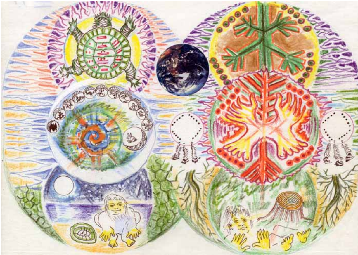
(17) DREAMS OF THE CHILDREN OF TIME