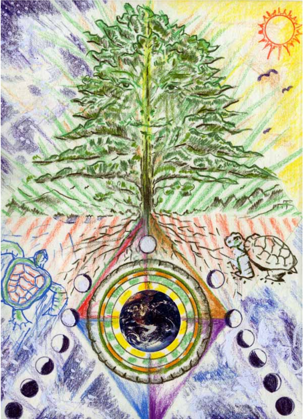
(5) TREE TALKS TIME