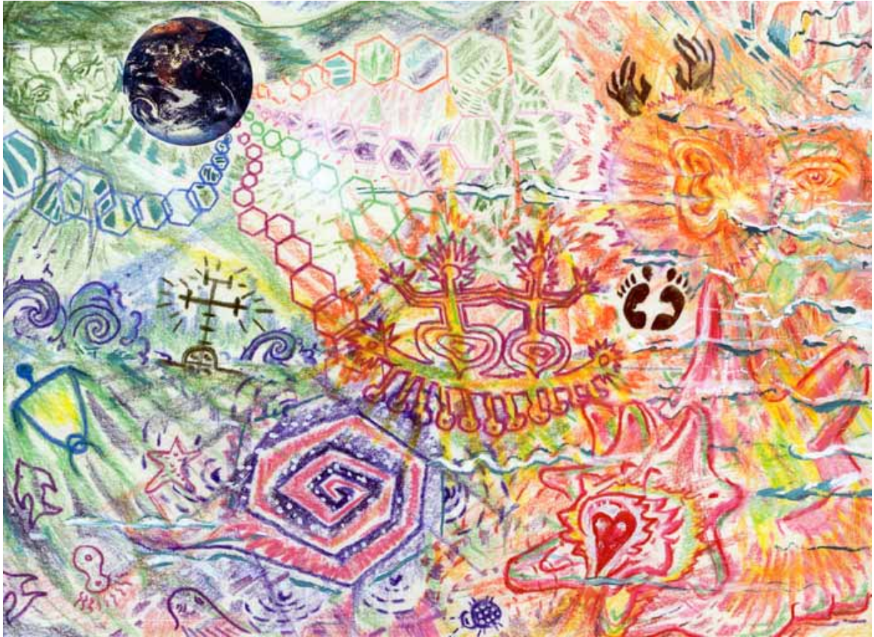
(12) GREAT GRANDMOTHER GALAXY TALKS CLOSE AND NEAR